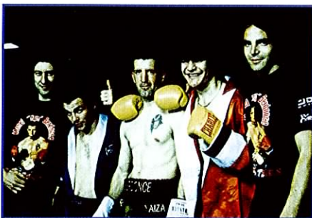
Reyes del Ko, uno de los grupos participantes.