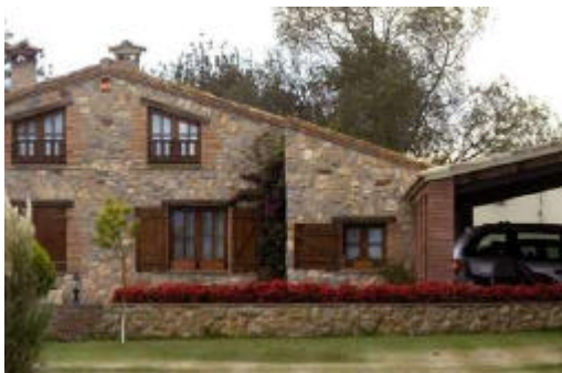
AMPLIAR FOTO