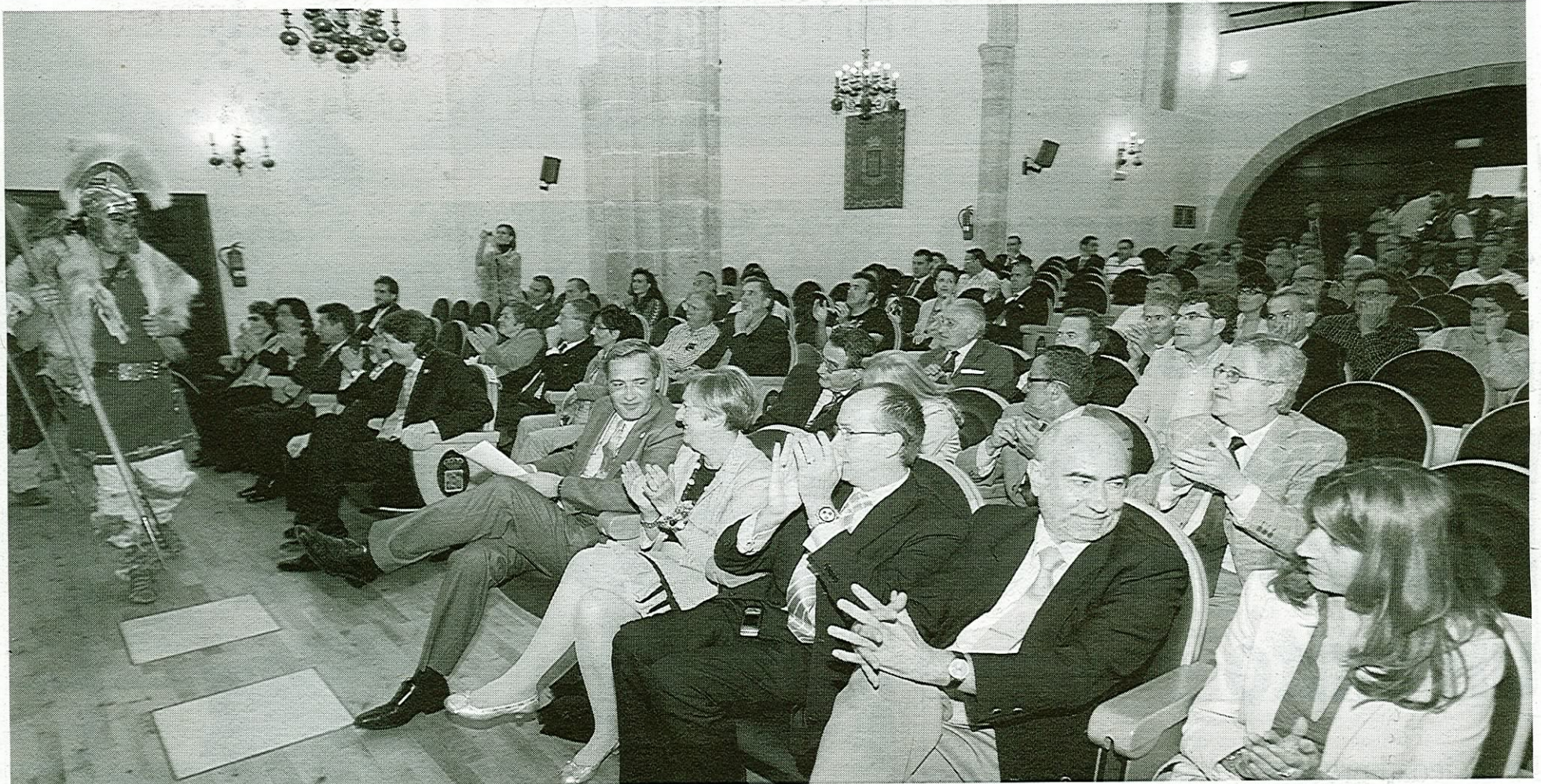
Representación de los integrantes de Tierra Quemada, ayer en la presentación de Soria y Turismo SA en el Aula Magna Tirso de Molina.