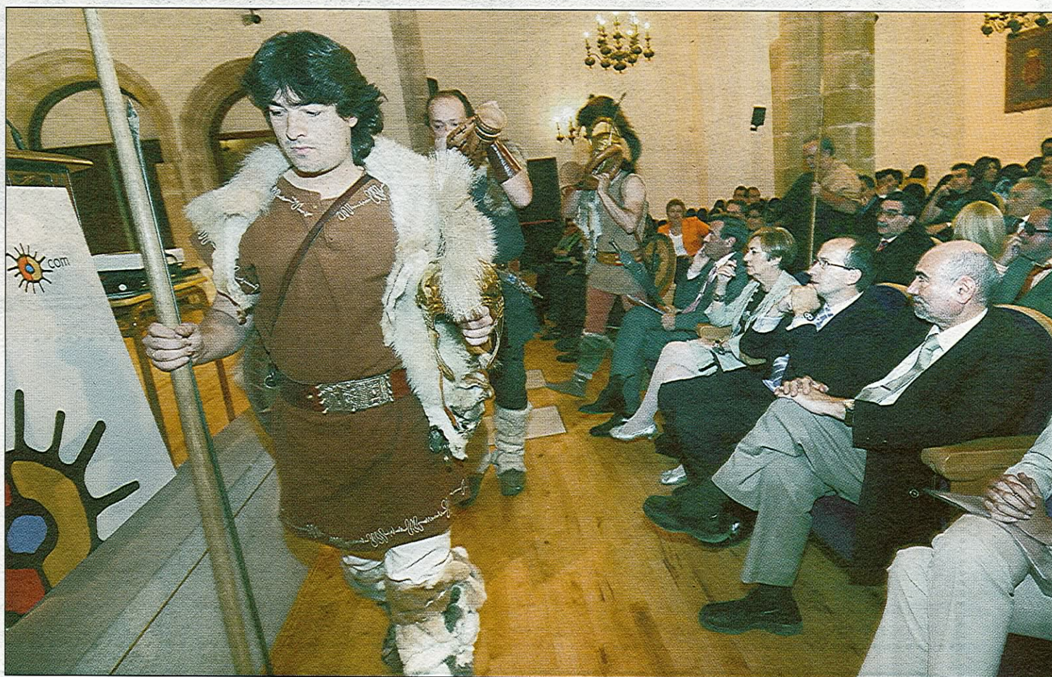
Una representación de los actores de Tierraquemada cerró el acto de presentación de 'Soria y Turismo'

En este análisis se realizará un repaso con los productores de actividades turísticas y de los distintos agentes para comprobar los paquetes turísticos que se pueden confeccionar y comenzar a vender. En este periodo se habilitará la página web de Soria y Turismo para comenzar la comercialización turística. «El objetivo», indicó Vitoria, es posicionar a Soria entre los destinos preferentes de turismo de interior, porque la provincia cuenta con suficientes posibilidades», a la vez que destacó que la venta nece-